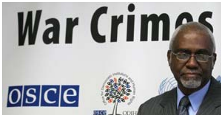
Predsjednik Robinson je održao uvodno izlaganje na predstavljanju projekta Pravda i ratni zločini u Apelacionom sudu u Beogradu, 28. septembra 2010.

Aktivnosti obuhvaćene ovim projektom uključuju izradu najmanje 60.000 strana transkripata sudskih postupaka pred MKSJ-om na lokalnim jezicima (bosanski, hrvatski, odnosno srpski), prevođenje 175.000 riječi iz baze podataka Sudska praksa Žalbenog vijeća MKSJ-a (ACCLRT) i razvoj nastavnih programa o međunarodnom krivičnom i humanitarnom pravu. Pored toga, ovaj projekat ima za cilj da se poveća broj ljudi koji će se baviti predmetima za ratne zločine u regionu, izradi priručnik najbolje prakse za advokate odbrane i održe sastanci kolega iz nacionalnih pravosudnih institucija i predstavnika MKSJ-a.